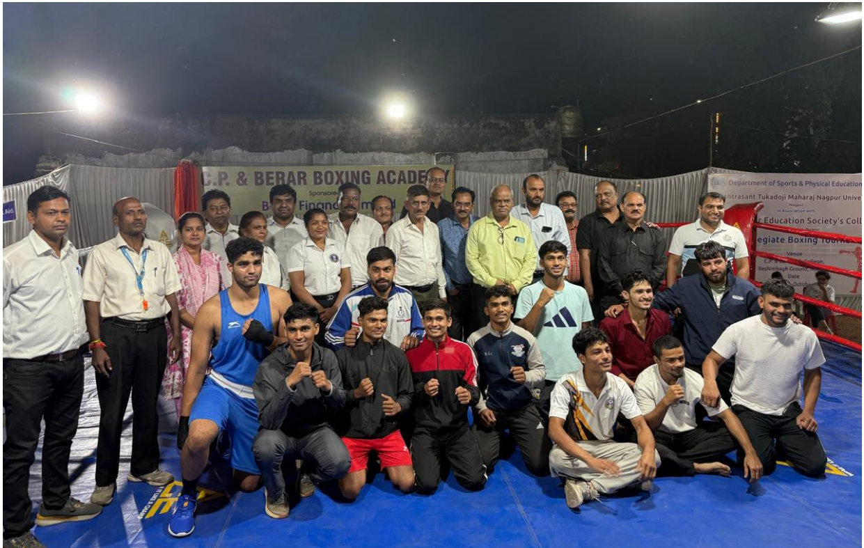
RTM Nagpur Inter Collegiate Boxing Men & Women Tournament Winners in Different Weight Category