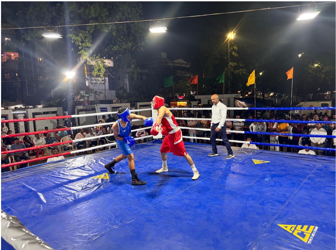
Players in Action in RTM Nagpur Inter Collegiate Men & Women Tournament (24.10.2024 & 26.10.2024)